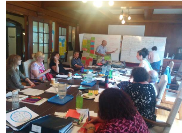
Lac à l'épaule Conseil d'Administration du RCCQ