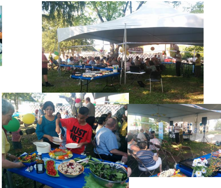
Souper 25 ans SGO