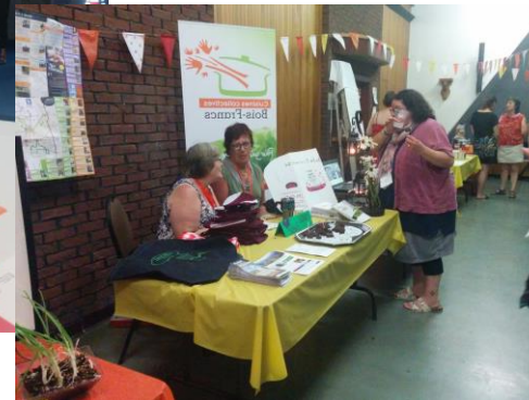
Journée Réflexion de la TCFDSO