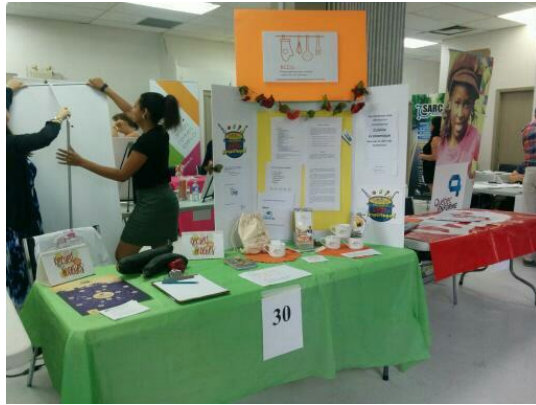
Foire communautaire Notre Dame