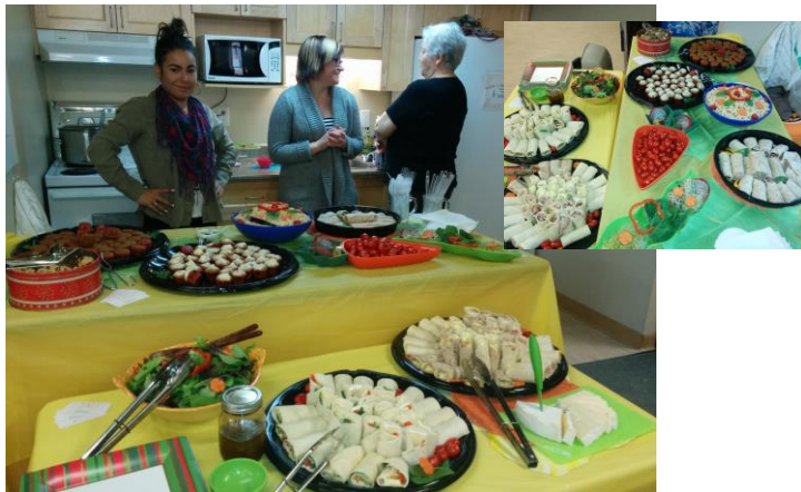
Lunch rencontre CCR OMHG