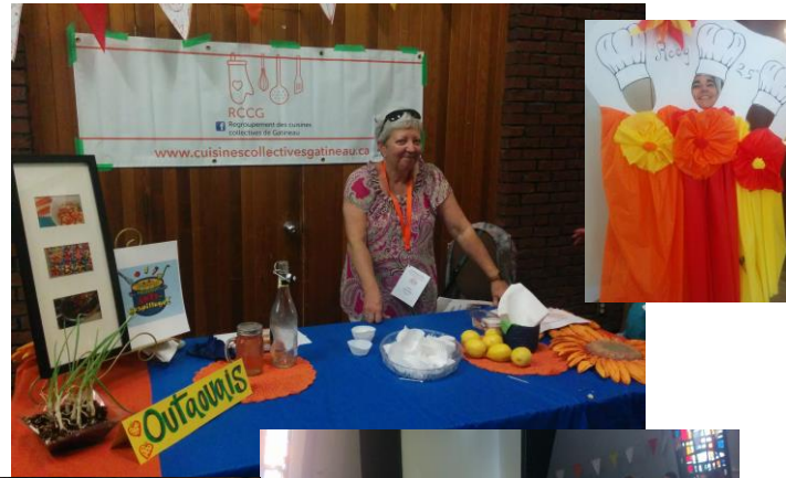
Marché solidaire au Colloque nationale des 25 ans du RCCQ